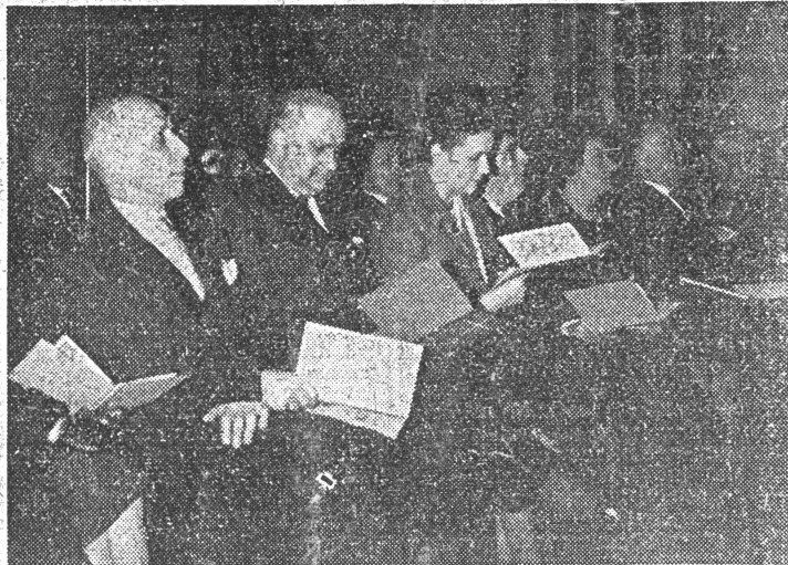
Une vue des personnalités présentes.